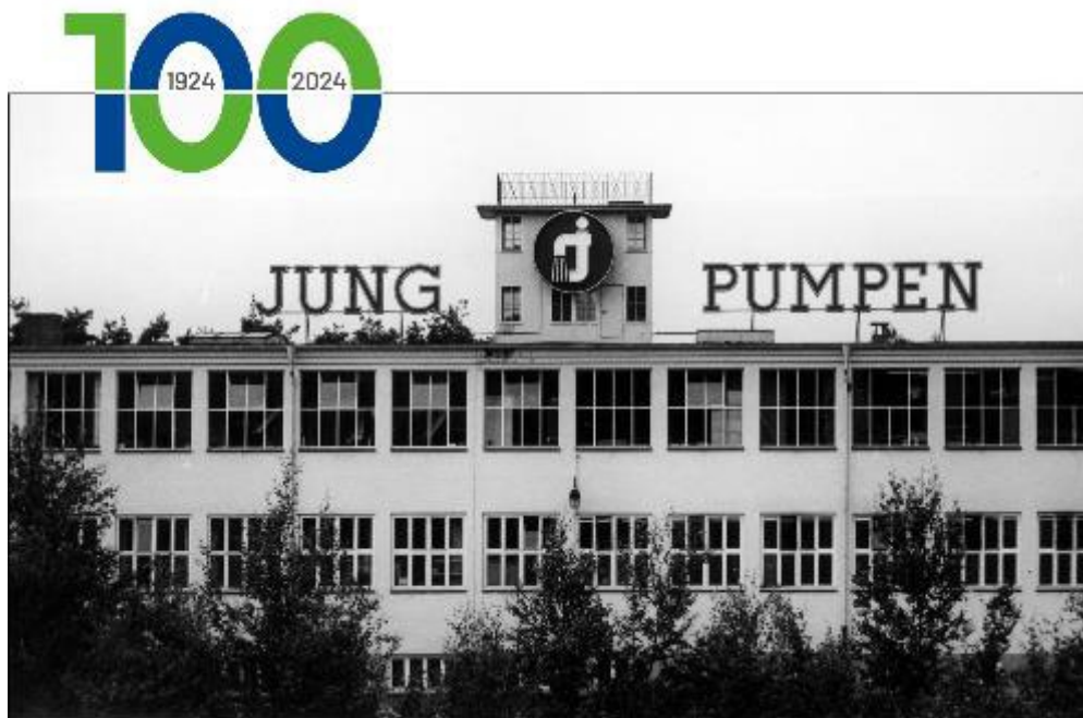
Bild 1: 100 Jahre Jung Pumpen – 100 Jahre Geschichte: hier das Hauptgebäude im Jahr 1954

Heinrich Christian Jung gründete das Unternehmen mit einem Gesellen und einem Startkapital von 1.000 Goldmark. Er begann mit der Konstruktion und Herstellung von handbetriebenen Jauchepumpen, die es den örtlichen Landwirten ermöglichte, Jauche aus Lagern oder Behältern als Dünger auf die Felder zu bringen. Auch Hauswasserwerke gehörten damals zum Programm.