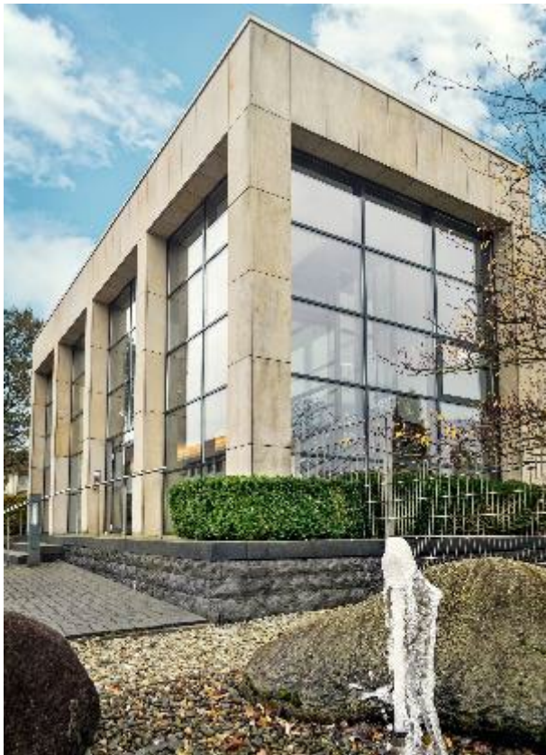
Bild 7: Weiterbildung von Marktpartnern im FORUM, dem Schulungszentrum in Steinhagen

Kompetenz unserer Belegschaft und auf die traditionell engen Beziehungen zu unseren Kunden. Mit einem flächendeckenden Außen- und Kundendienst bieten wir umfassende Beratung und Unterstützung direkt vor Ort. Unsere zahlreichen Seminare und Veranstaltungen dienen dem regen Austausch und der umfassenden Information. Diese ganzheitliche Präsenz bestätigt Jung Pumpen als Premiummarke und soll uns weiterhin zukunftsweisende Impulse geben.“