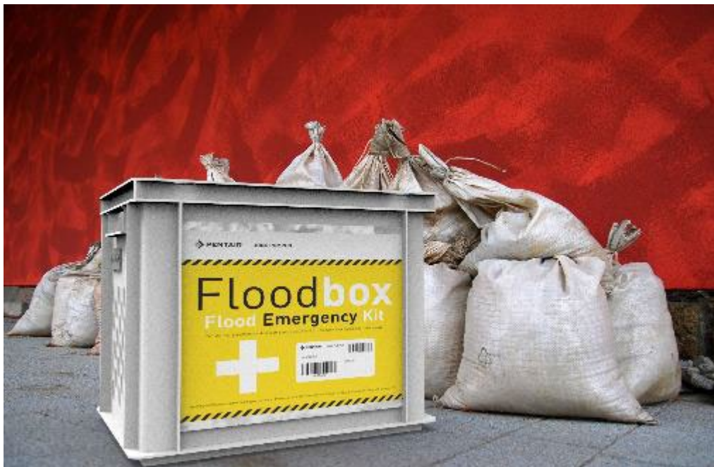
Bild 6: Die Flutbox, das Erste-Hilfe Set bei Hochwasser, wird auch international stark nachgefragt.

Jung Pumpen ist nicht nur ein Unternehmen mit einer reichen Geschichte, sondern orientiert sich stetig an den Herausforderungen der Zeit. So spielt z.B. für eine älter werdende Gesellschaft das komfortable Wohnen zuhause eine große Rolle. Mit der Bodenablaufpumpe Plancofix wurde eine technische Lösung geschaffen, die barrierefreie Duschen in bestehenden Bädern nahezu überall möglich macht. Als Antwort auf die steigenden Probleme durch Starkregen und die daraus resultierenden Kellerüberflutungen, wurde die Flutbox entwickelt – ein Erste-Hilfe-Set, mit dem Keller oder Tiefgaragen in Eigenregie leergesaugt werden können. Als technische Lösung gegen Verstopfung von Abwasserpumpen die zunehmend mit langfaserigen Feuchttüchern konfrontiert sind, entwickelte Jung Pumpen ein neuartiges Schneidsystem für seine MultiCut-Abwasserpumpen und setzte damit Maßstäbe.