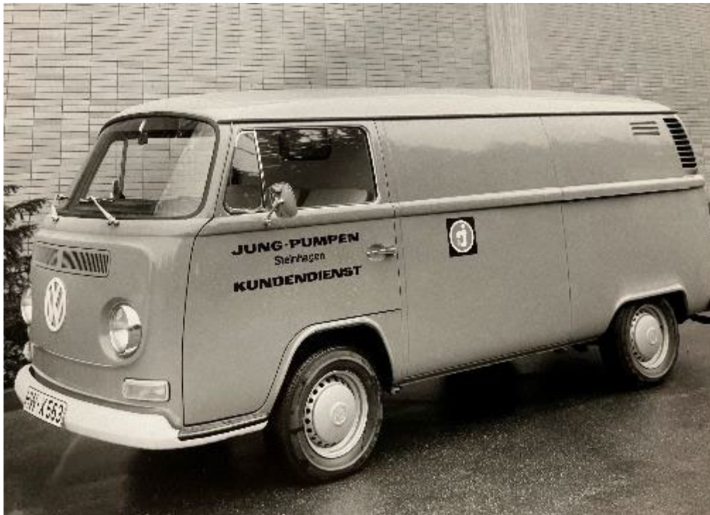
Bild 5: Ein deutschlandweiter Kunden- und Außendienst betreut schon in den 60er Installateure und Endkunden