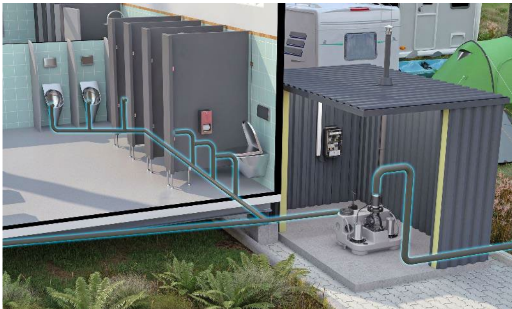
Fig. 2: De krachtige Compli 1100 E Drena-Line is compact en veelzijdig. Hier pompt het het afvalwater van de sanitaire ruimte van een camping in het openbare riool om terugstroming te voorkomen.