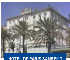
HOTEL DE PARIS SANREMO