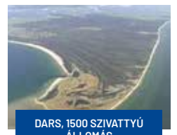
DARS, 1500 SZIVATTYÚ ÁLLOMÁS